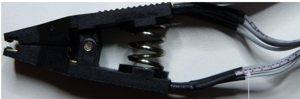
In-System Buchse für DIL-ICs In-System socket for DIL-ICs

Test-Clip; Pin 1 (Beim SMD-IC oben links, linke Seite; von oben gesehen. IC besitzt dort eine Kerbung/Lochvertiefung und ggf. ist die Seite des Chips dort abgeschrägt).