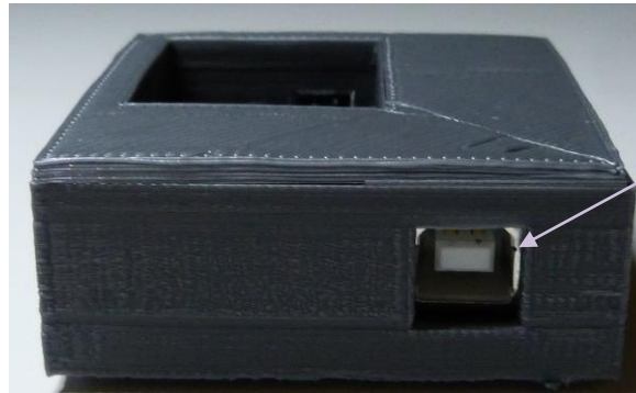
USB-Anschluss USB connector